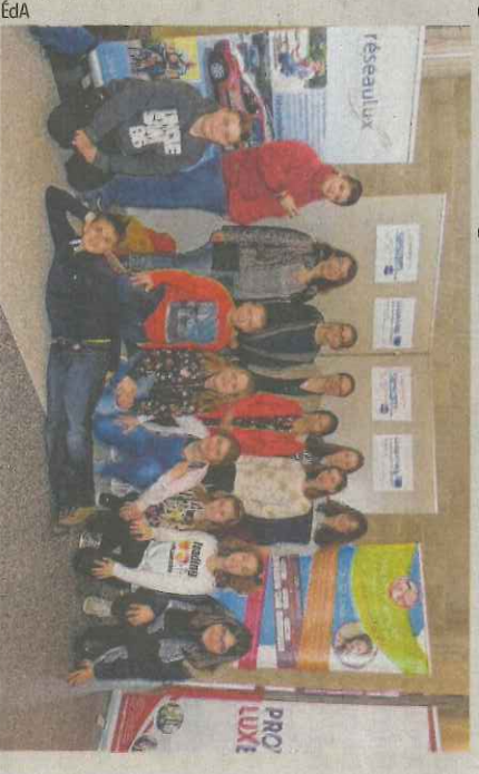
Les élèves de Schengen ont apprécié leur passage sur la scène arlonaise.

« Nous avons inventé une pièce en anglais-français dans le cadre de l'atelier théâtre de l'école. Cette pièce comparait